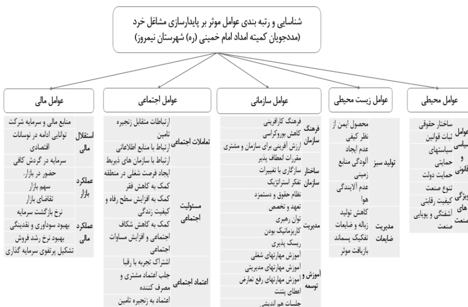
شکل ۱: مدل مفهومی عوامل مؤثر بر پایداری مشاغل خرد (منبع: یافته‌های تحقیق)

در ابتدا به روش مصاحبه معیارها و زیرمعیارها شناسایی می‌گردد، سپس با استفاده از نرم‌افزار MAX QDA، تحلیل تم و طراحی مدل صورت می‌پذیرد و معیارها و زیر معیارهای شناسایی شده در بخش کیفی، جهت راست آزمایی و رتبه‌بندی از تحلیل عاملی تأییدی و مدل معادلات ساختاری، در نرم‌افزار PLS استفاده می‌شود. جامعه آماری بخش کیفی پژوهش شامل اساتید، کارشناسان و خبرگان حوزه مربوطه می‌باشد و جامعه آماری بخش کمی پژوهش کلیه مددجویان کمیته امام خمینی (ره) شهرستان نیمروز استان سیستان و بلوچستان هستند تشکیل می‌دهد که در بخش کارآفرینی و کسب‌وکار، فعال می‌باشند و در بازه سنی ۲۰ تا ۵۰ سال قرار دارند. طبق آمار گزارش شده ۱۷۱۳۰۰ نفر می‌باشند.